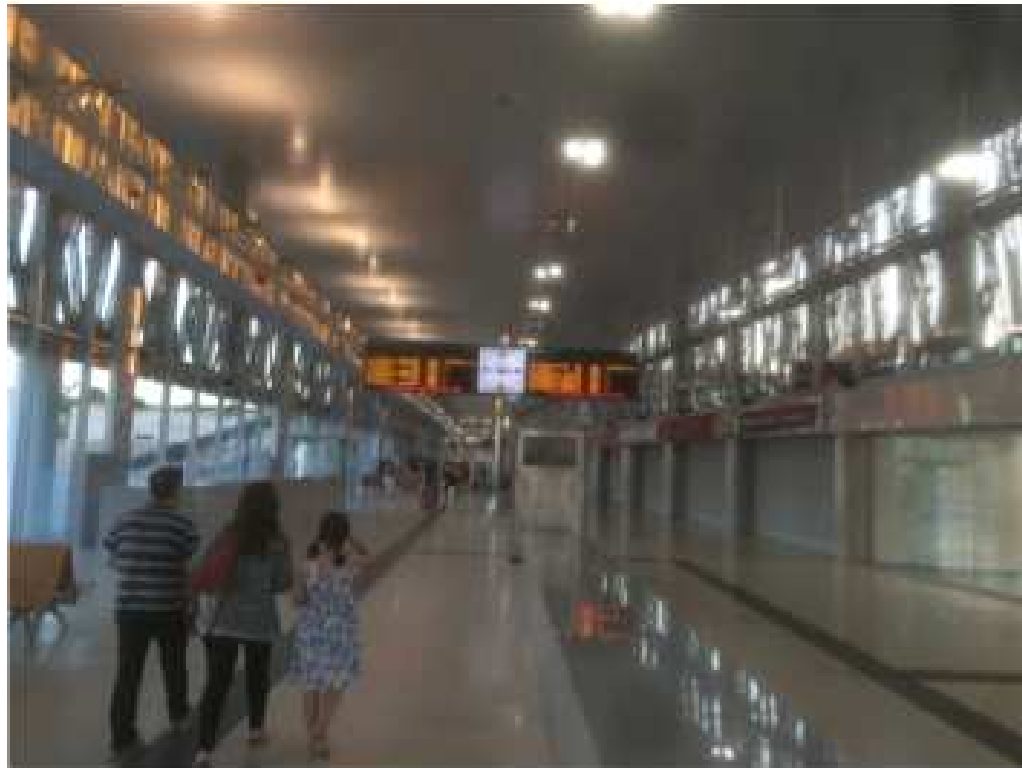
Estación del AVE (Cuenca, 55.738 habitantes)